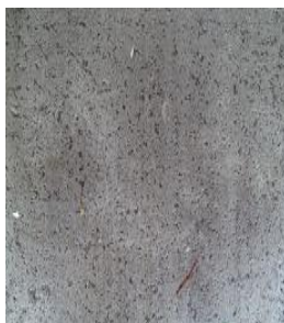
(スーパーコートAZ塗布)