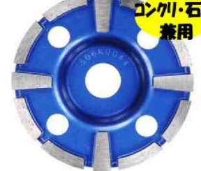
【ドライサーフェーサー-DX】