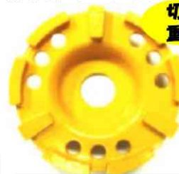
【ドライサーフェーサー-90mm】