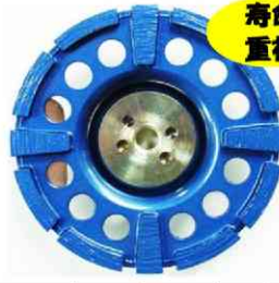
【サーフェーサー-EスDX】