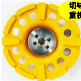
【サーフェーサー-Eス】