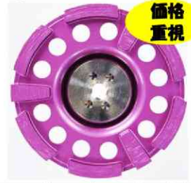
【サーフェーサー-Eスライト】